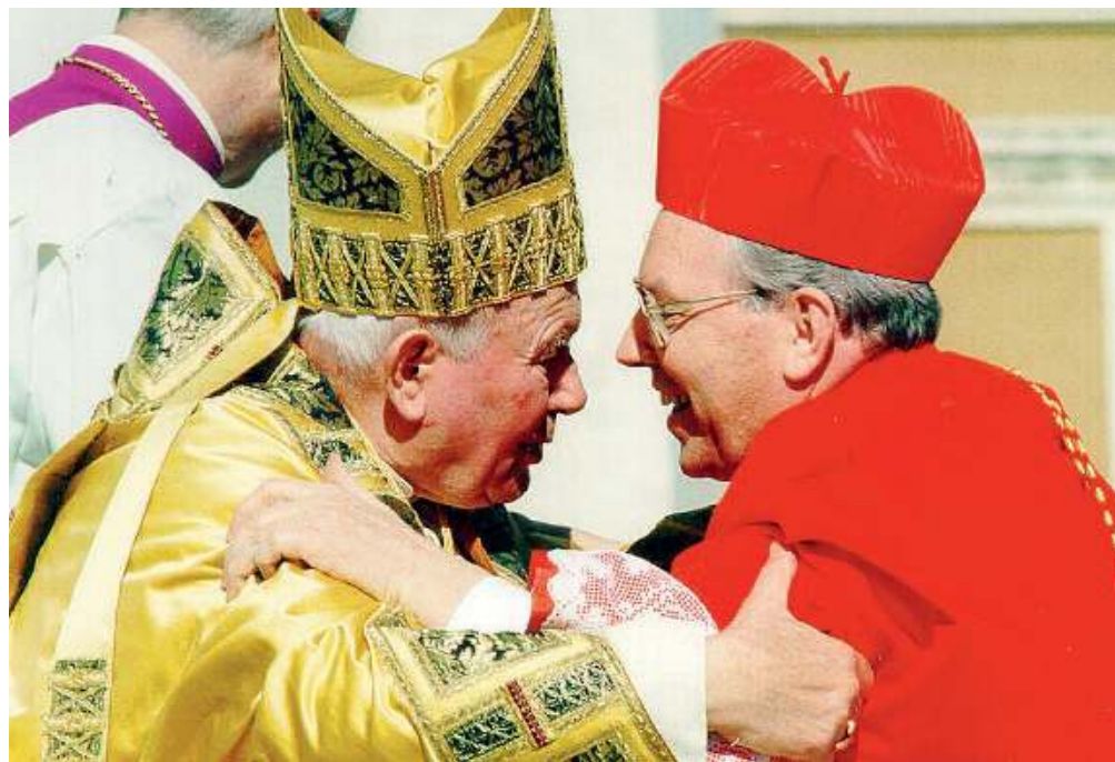
Il legame. Giovanni Paolo II con il cardinale Giovanni Battista Re durante la cerimonia di consegna della porpora

«Ringrazio di vero cuore Dio per aver vissuto una grande stagione della Chiesa - racconta il cardinale Re -, e aver avuto la possibilità di conoscere da vicino la bontà paterna di san Giovanni XXIII, l'incontenibile ansia apostolica di