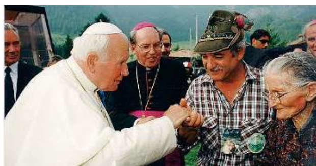
Vicinanza. Papa Wojtyła e l'allora monsignor Re a Borno nel 1998

Tra i due c'era una profonda amicizia, un legame che portò papa Wojtyła il 18 luglio 1998 a visitare Borno, paese natale del porporato. Per un giorno il Papa ha soggiornato nel comune camuno, ha visitato la baita di legno di Croce di Salven dove il cardinale Re passa l'estate, tra gli amici, i parenti. Tutti a Borno lo considerano uno di famiglia, «l'amico del Papa» con cui si può scambiare qualche parola, per la strada o - più facilmente - sui sentieri di montagna lungo i quali il porporato ama passeggiare. Una