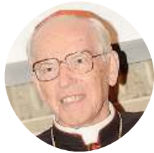
Giovanni Battista Re Cardinale

«Tre Papi grandi legati al Concilio Vaticano II che hanno lasciato un segno indelebile»